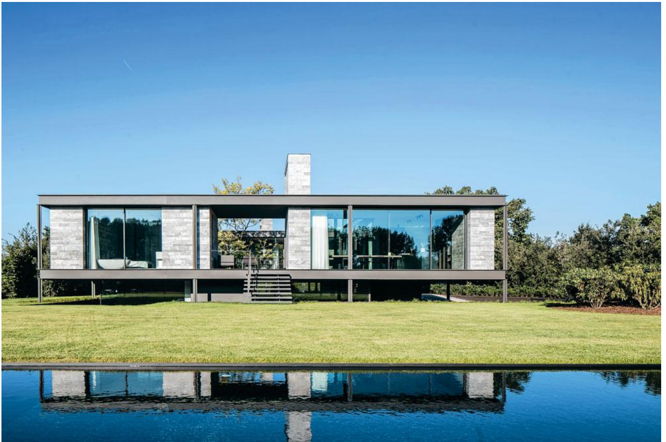
Het stalen skelet van de woning is bewust zichtbaar gelaten. Daarbinnen zijn volumes geschoven, die bekleed zijn met natuursteen.