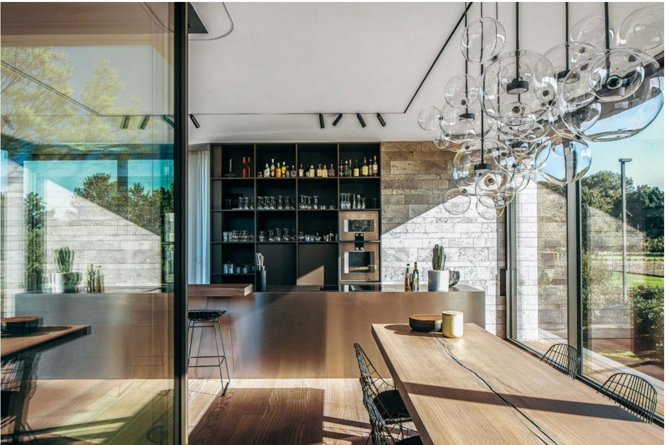
Al het staalwerk is gelakt in een grijsgroene tint, niet in steriel zwart.