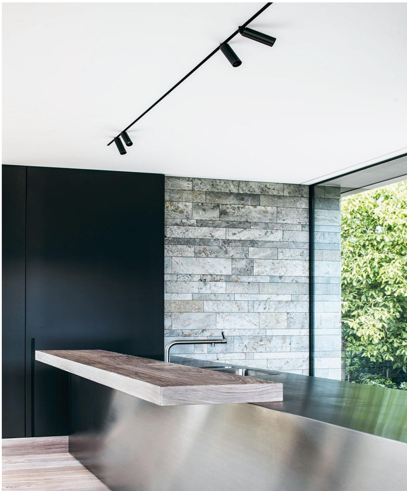
Pierre de Varennes komt overal in de woning terug, zowel binnen als buiten, zowel aan de wanden als op de vloer. Het materiaal geeft de woning textuur en warmte.