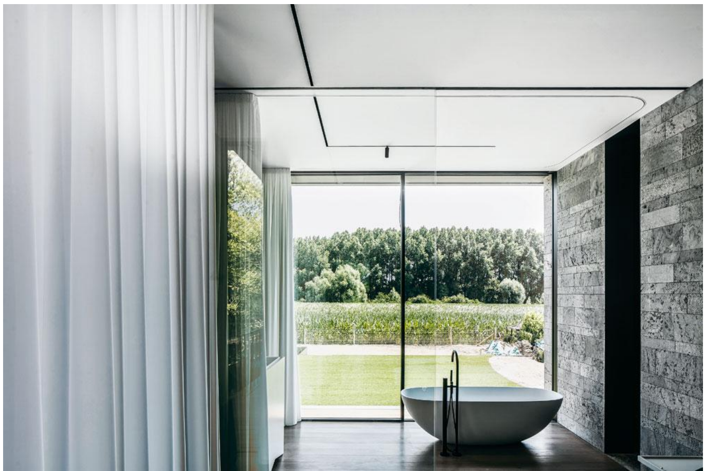
Doordat de woning op palen staat, kijkt ze uit over het landschap. Aan de achterkant is dat een vallei waar reeën en vossen rondlopen, aan de voorkant enkele pittoreske boerderijen.