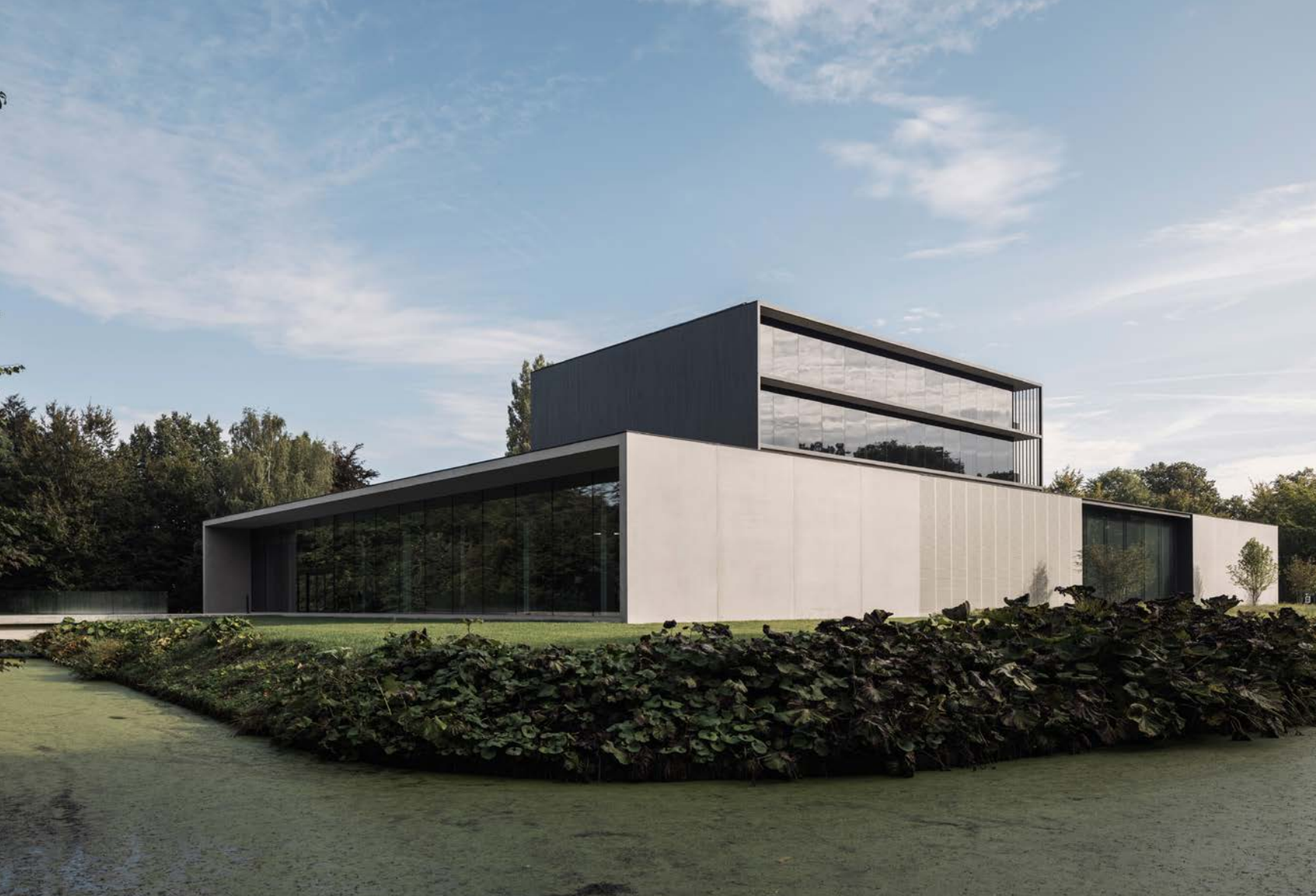
Het gebouw straalt een historische waarde uit en belichaamt tegelijkertijd een vooruitstrevende visie op duurzaam bouwen.